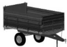
1 - EIXO SIMPLES

3 - ESTRUTURA CONSTRUÍDA POR VIGAS TUBULARES DE ALTA RESISTÊNCIA