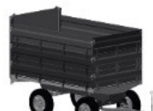
2 - EIXO S/ 3 GUARDAS