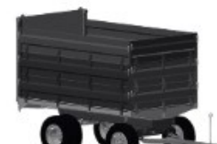
2 - EIXO D/ 3 GUARDAS