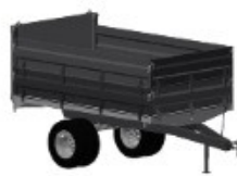
1 - EIXO DUPLO