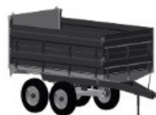
1 - EIXO TANDEM