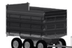
2 - EIXO T/ 3 GUARDAS